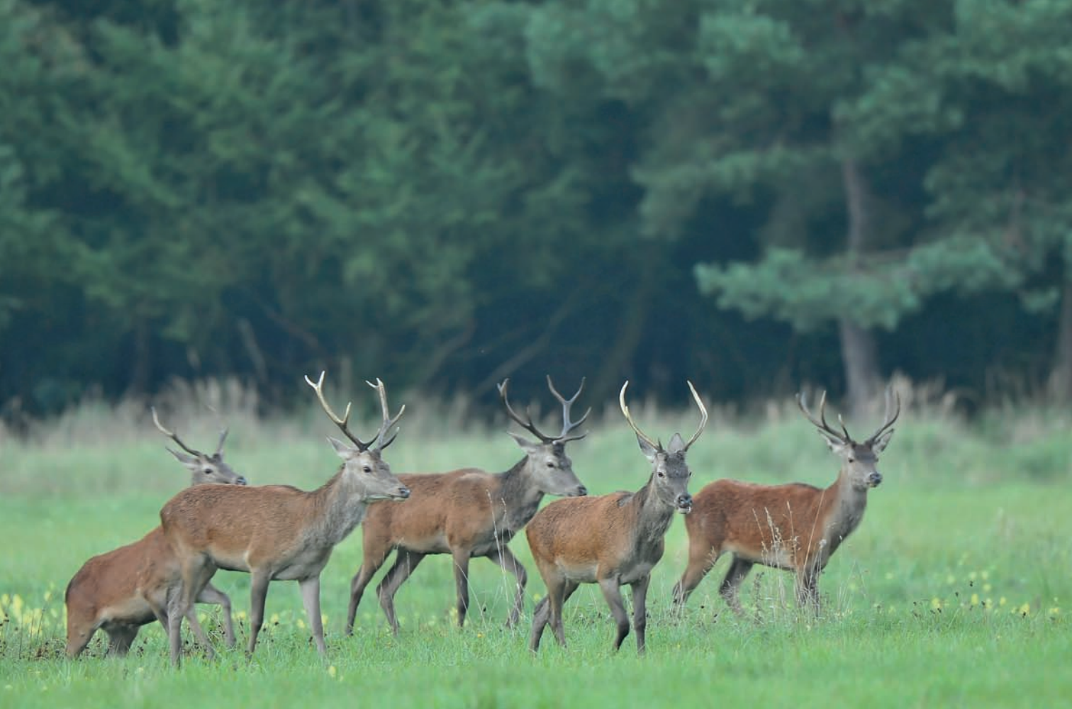
Fotografia 4.15. Kolejne ujęcia jeleni wprost z zasiadki