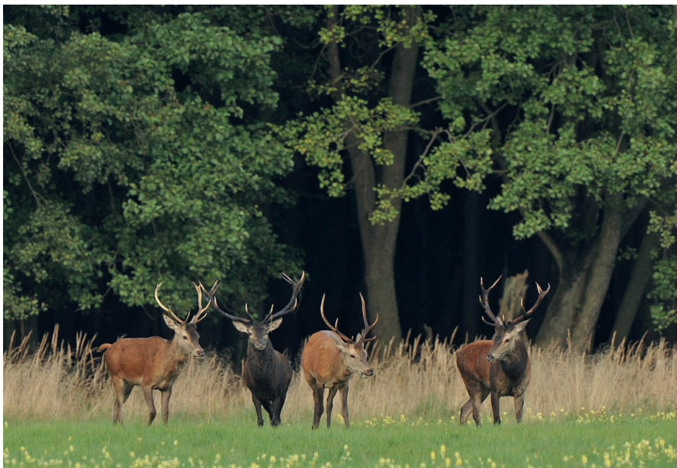
Fotografia 4.14. Jelenie wychodzące z lasu właściwie naprzeciwko zasiadki