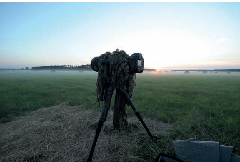
Fotografia 4.8. Dobrze jest przykryć aparat i obiektyw siatką maskującą