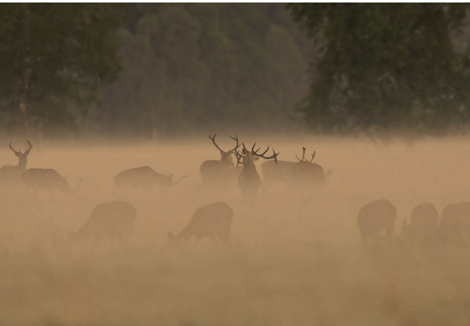
Fotografia 4.1. Jelenie na rykowisku