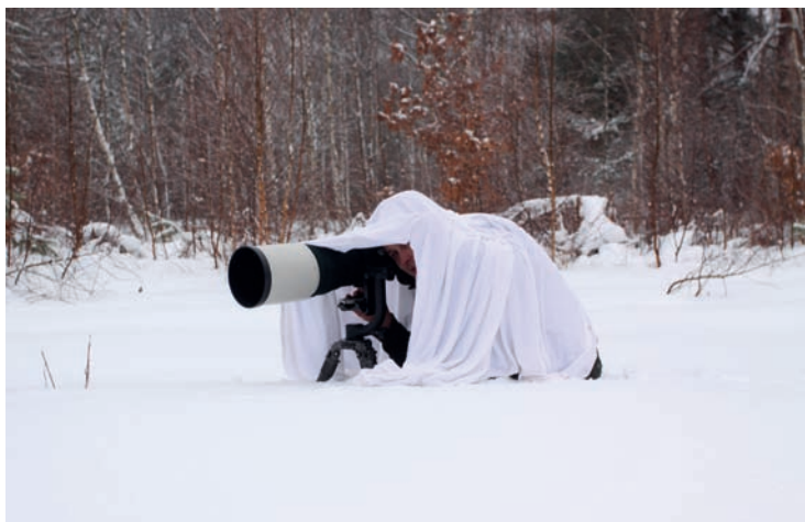
Fotografia 4.6. Zimowy sposób maskowania

zobaczą jakikolwiek ruch — zaraz uciekają. Dobrze jest, stosując tę metodę, nałożyć na zestaw aparat-statyw-objektyw siatkę maskującą (fotografia 4.8), która może swobodnie zwiisać z obiektywem, stając się naturalną osłoną zarówno w chwili podchodu, jak i samego fotografowania. Zimą taką funkcję bardzo dobrze spełnia zwykłe prześcieradło (fotografie 4.5 i 4.6).