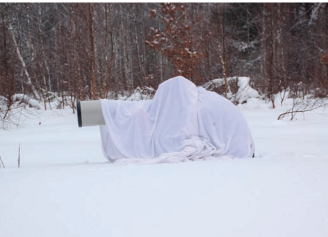
Fotografia 4.5. Zimowa ostona — zwykzajne prześcieradło