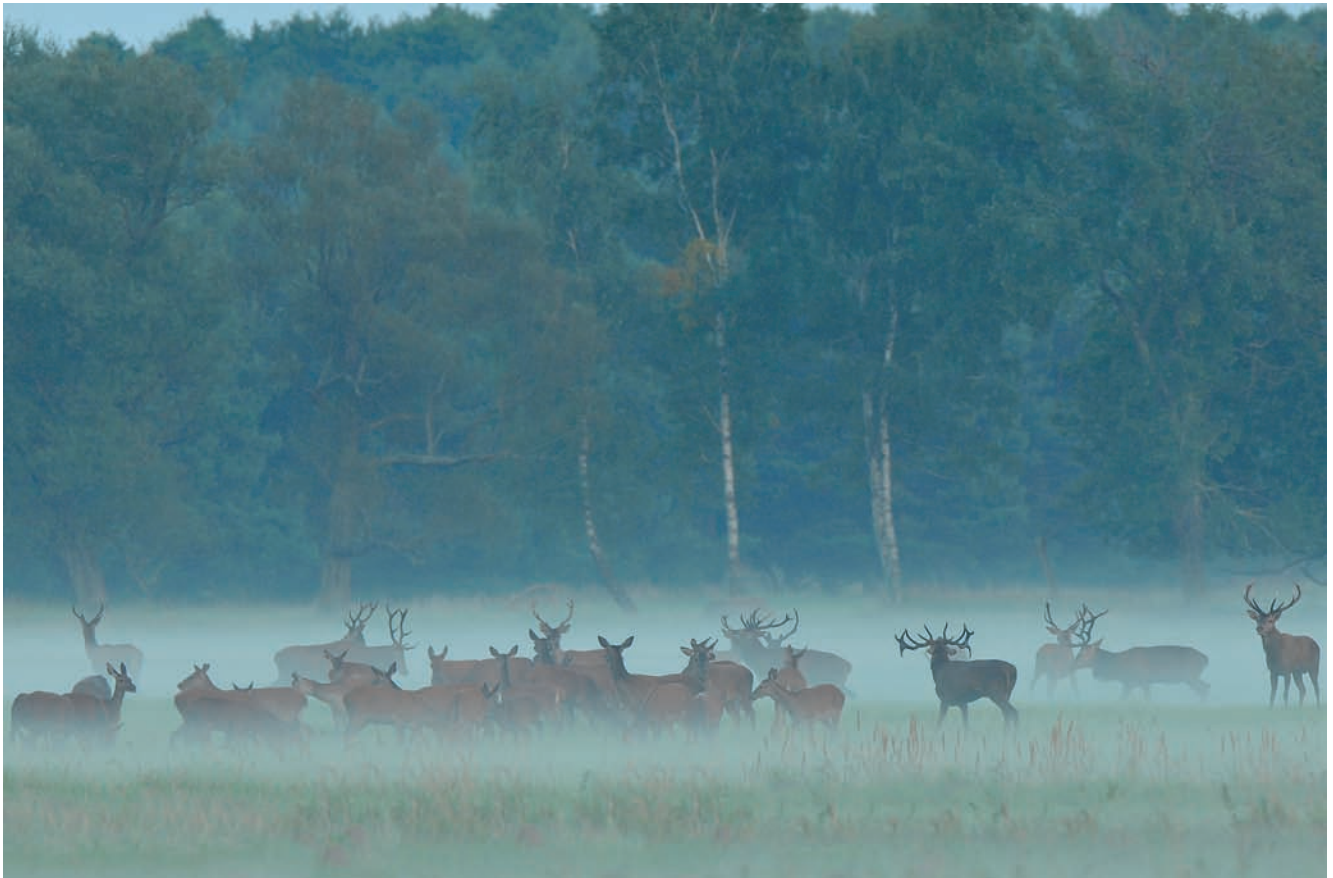
Fotografia 4.18. Rano łąki są osnute mgłą, która dodaje zdjęciom atmosfery magii i tajemniczości

b) Wieczór — to najlepsza pora na fotografowanie ssaków ze względu na to, że to my czekamy na nie i możemy się przygotować wcześniej na ich pojawienie się. To właśnie wieczorem stosuje się zasiadkę w formie mobilnej chatowni lub obserwacji z ambon połączonej z podchodem. Kluczem do sukcesu w tej metodzie fotografowania jest znalezienie takiego miejsca, gdzie zwierzęta wychodzą z lasu, jak najwcześniej — dajemy sobie tym samym szansę na zrobienie zdjęć. Fotograf zwierząt ciągle goni za światłem i niestety z reguły jest tak, że owszem, zwierzyna wychodzi na żer w miejscu przez nas zaplanowanym, ale wtedy gdy zapas