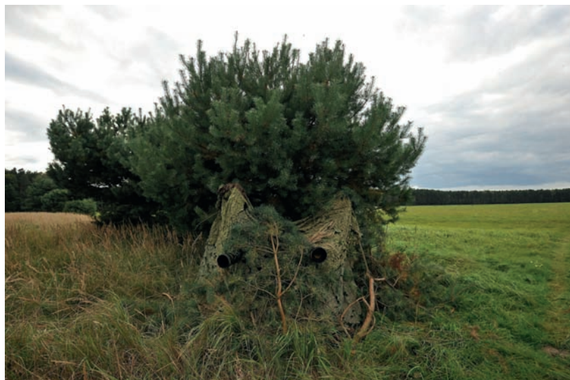
Fotografia 4.12. „Na szybko” rozwieszona siatka maskująca, pod którą oczekujemy na wyjście zwierząt z lasu