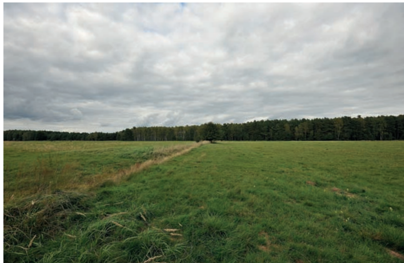
Fotografia 4.11. Ściana lasu, z którego prawdopodobnie wieczorem wyjdą jelenie. Ważnym elementem rozstawienia zsiadki jest rów, który w wypadku konieczności podchodzenia jest naturalną osłoną dającą możliwość na zbliżenie się do zwierząt