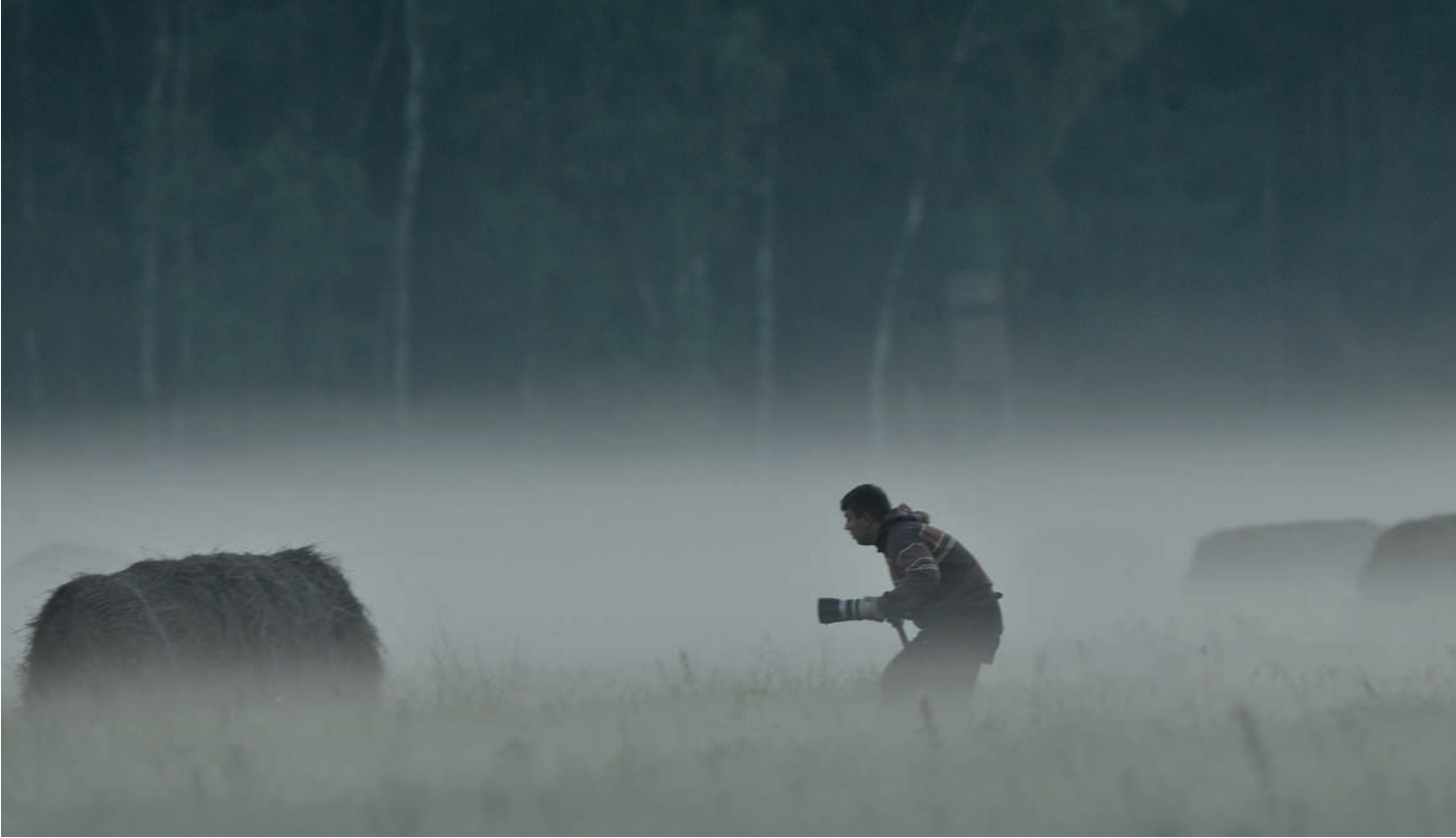
Fotografia 4.7. Podczas podchodu wykorzystujemy wszystkie naturalne osłony — snopy siana i mgłę