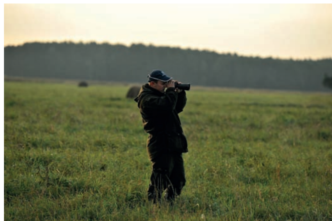
Fotografia 4.9. Dobrym zwyczajem jest częste obserwowanie terenu przez lornetkę — to my jesteśmy wtedy pierwszymi, którzy namierzają zwierzyńę, a nie odwrotnie