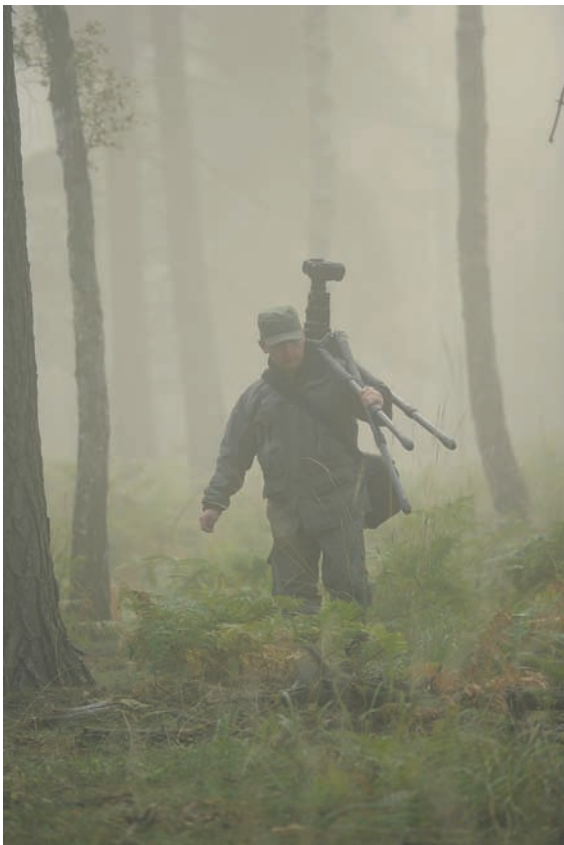
Fotografia 4.10. Podchód skrajem lasu w gęstej mgle jest bardzo skuteczny