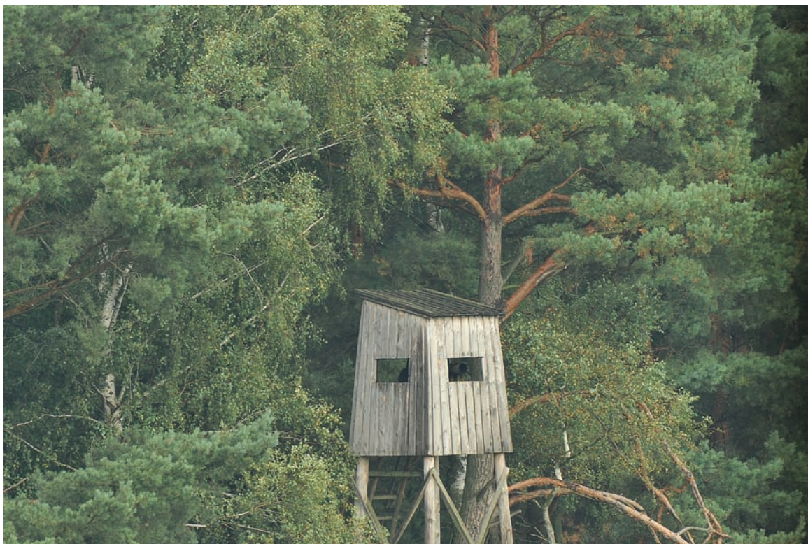
Fotografia 4.2. Oczekiwanie na ambonie jest bardzo skuteczne, gdyż jest małe prawdopodobieństwo, że zwierzęta nas zwietrzą

konieczność, powoli na klęczkach zbliżamy się do celu. Podchodząc, musimy robić to tak, aby wykorzystywać wszystkie osłony terenowe — rowy, kępy krzewów, wysoką trawę itp. Ale jeśli nie ma się za czym schować, lepiej wcale nie podchodzić i po prostu liczyć na to, że zwierzęta same się zbliżą. Pamiętajmy, aby przez cały czas podchodu widzieć, czy zwierzęta akurat nie wypatrują. Jeśli podniosą głowy i nasłuchują — zatrzymujemy się w bezruchu, czekając, aż zaczną ponownie żerować, potem robimy kilka — kilkanaście kroków, zastygamy — i tak aż do osiągnięcia odpowiedniej odległości. Pamiętajmy, że ssaki nie reagują zbyt mocno na statyczne elementy otoczenia, jednak jeśli