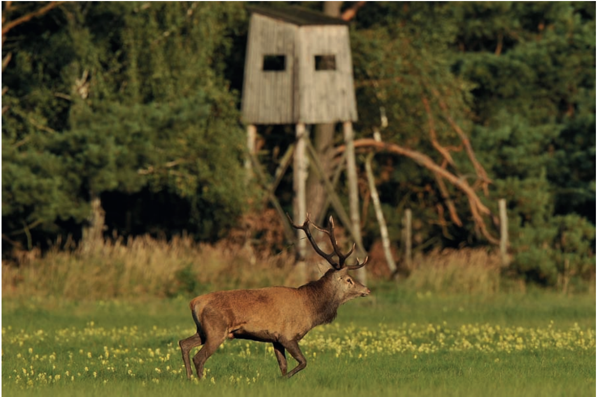
Fotografia 4.3. Gdy zwierzęta wyjdą na otwartą przestrzeń, schodzimy z ambony i robimy zdjęcia z odpowiedniej perspektywy